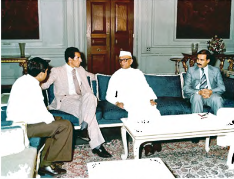
خلال زيارة عبد السلام جلود للهند، وجانب من لقاءه رئيسها نيلام سانجيفا ريدي .